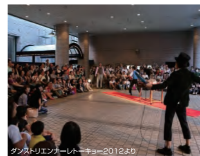
ダンストリエンナーレトーキョー2012より